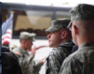
In der Armee