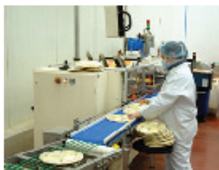
In der Ernährungswirtschaft